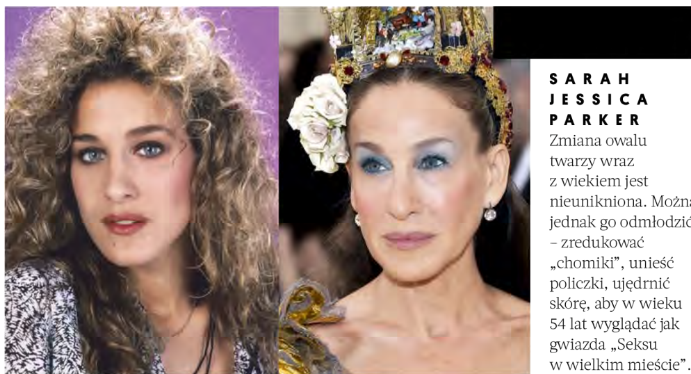
SARAH JESSICA PARKER

To nici z haczykami bądź mikrowypustami, dzięki którym można rzeczywiście mechanicznie unieść tkanki. Są one wprowadzane punktowo poprzez małe wkłucia, dzięki czemu zabieg nie wymaga długiej rekonwalescencji. Mogą to być nici rozpuszczalne bądź stałe (jak np. w trudnej, ale dającej niesamowity efekt odmłodzenia technice Easylift). Nici rozpuszczalne (np. PDO) dodatkowo stymulują skórę do odnowy, pobudzając w niej produkcję kolagenu, dzięki czemu efekt nasila się jeszcze w czasie. Nowością na rynku są nici liftingujące Aptos Excellence Visage z dodatkiem kwasu hialuronowego, które dodatkowo zapewniają skórce natychmiastowe nawilżenie i rewitalizację.