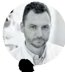
Dr Dariusz Grzegorzczuk Lekarz medycyny estetycznej www.dreamlift.pl

Nawet w przypadku naturalnych (będących następstwem procesów starzenia) defektów estetycznych, jak wiotczenie skóry, utrata jej jędrności, zanik owalu, najważniejsze w praktyce medycznej jest indywidualne podejście do pacjenta. Po dokładnym zdiagnozowaniu stanu skóry, głębokości i rozległości zmian, możemy zbudować skuteczne plany terapeutyczne: dające długotrwałe efekty, niewymagające długiego okresu rekonwalescencji, niemal bezbolesne i nieinwazyjne. Bardzo dobre efekty dają nowoczesne technologie, np. HIFU, resurfacing laserowy frakcyjny, ablacyjny laser Alma Pixel czy terapia RF Attiva. Warto też zastymulować skórę osoczem bogatopłytkowym, a ubytki objętościowe uzupełnić kwasem hialuronowym lub tkanką tłuszczową. Polecam także terapię SVF z komórkami macierzystymi.