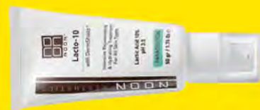
KREM LACTO-10 [210 ZŁ] Z 10% KWASEM MLEKOWYM NAWILŻA I ODMŁADZA TWARZ, SZYJĘ I OKOLICE OCZU.

Wyjątkowa technologia DermShield™ pozwala wprowadzać do skóry aktywne składniki w wysokich, naprawdę działających stężeniach, z nisko dostosowanym pH – ale bez podrażnień, i to przez cały rok. Do wyboru jest kilka linii zabiegowych In-Clinic, które są bardzo precyzyjnie dobierane do konfiguracji problemów i rodzaju skóry pacjenta. Efekty serii zabiegów zarówno przeciwstarzeniowych, jak i przeciwtrądzikowych są oszałamiające. A niezbędne między zabiegami, odpowiednio dobrane, stanowiące przedłużenie zabiegu kosmetyki są uwielbiane przez nasze pacjentki.