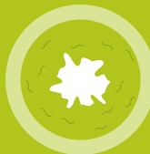
Cewka moczowa nie trzymająca moczu